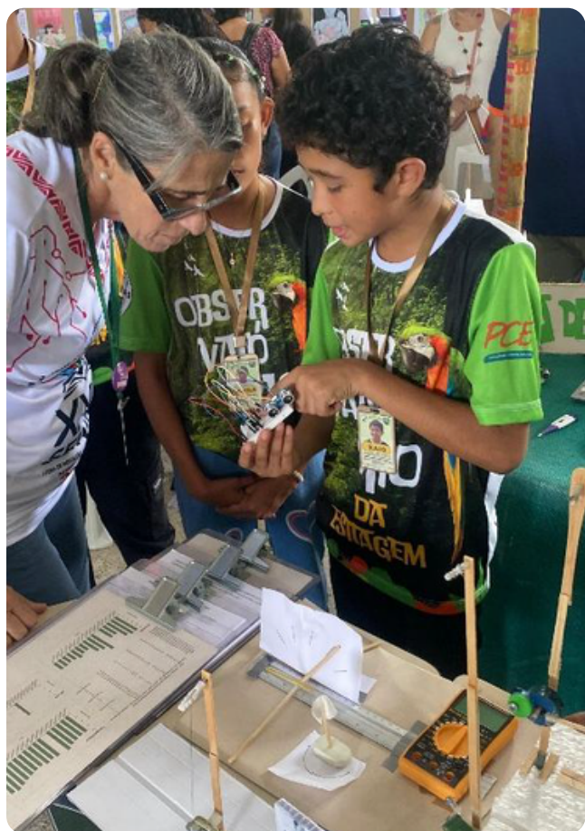
Apresentação dos resultados

Estudantes do 6º ano da Escola Municipal São João, localizada na Reserva de Desenvolvimento Sustentável do Tupé , em Manaus (AM), desenvolveram o Observatório da Estiagem, um protótipo STEAM para monitoramento ambiental de baixo custo. Essa solução inclui instrumentos artesanais como pluviômetro, higrômetro, régua de nível e um sistema eletrônico com sensor ultrassônico para medir a distância da água em poços, todos construídos com materiais recicláveis e componentes eletrônicos acessíveis.