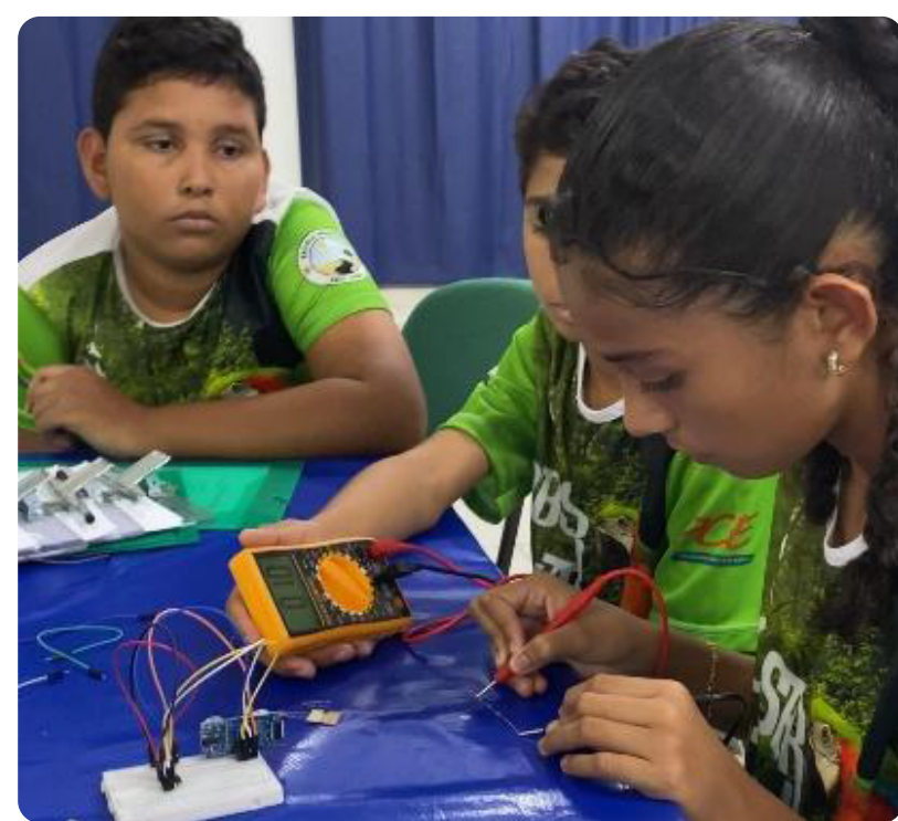
Hora da prototipação

Além dos equipamentos físicos, os estudantes criaram um Sistema de Alerta Comunitário que utiliza um blog criado no Canva® e um grupo de WhatsApp® para divulgar boletins diários com dados de temperatura, umidade e nível do rio. Assim, a comunidade acompanha em tempo real a evolução da estiagem , recebe alertas sobre risco de queimadas e prepara-se para os impactos climáticos. O projeto STEAM uniu saberes tradicionais locais com tecnologia acessível, promovendo resiliência socioambiental na Amazônia.